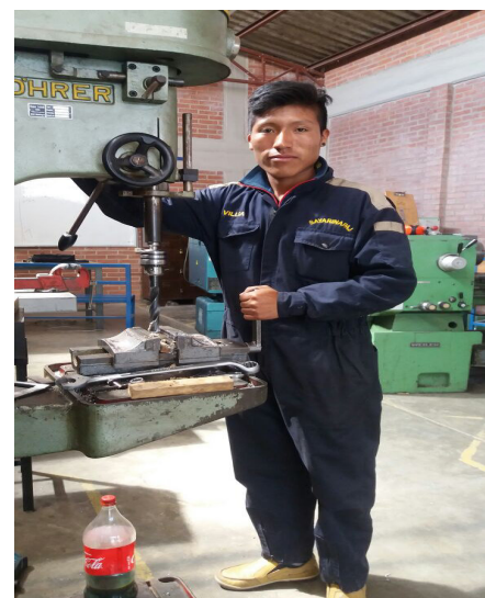
Ausbildung als Industriemechaniker

Eine Ausbildung in einem der genannten Bereiche dauert drei Jahre. Sie soll über ein Stipendium finanziell abgesichert werden. Gleichzeitig sollen sich die Jugendlichen verpflichten, nach Abschluss der Ausbildung zwei Jahre lang als Freiwillige die Arbeit in den Hogares Internados Campesinos, den Wohnheimen in Norte Potosí, zu unterstützen. Es handelt sich also um eine Win-Win-Situation: Die Jugendlichen erhalten ein Ausbildungsstipendium, die Misión Mitarbeiter für die Wohnheime.