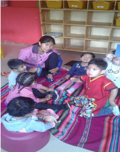
Ausbildung als Erzieherin