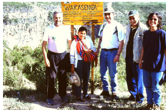
Besuch in Norte Potosí 2003