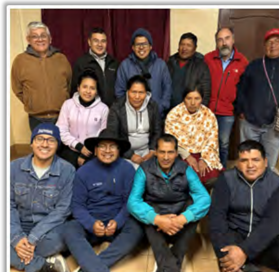
Foto oficial con los directores y tutores del HIC.

Esta capacitación nos ha permitido tomar decisiones importantes en pro de la protección de los menores y personas vulnerables.