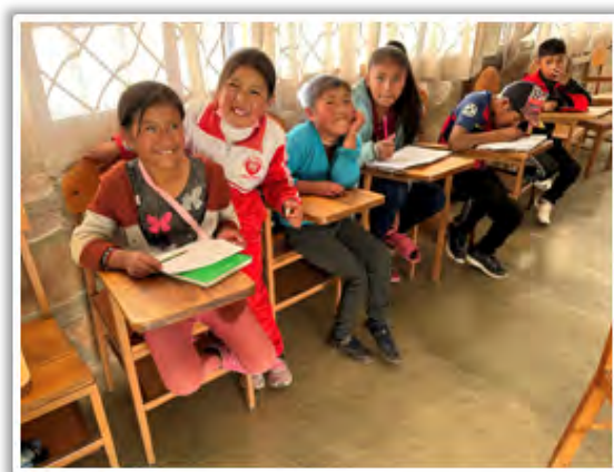
Niños de la primera comunión.