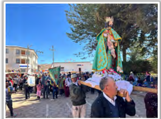
Procesión en honor a Tata San Luis.