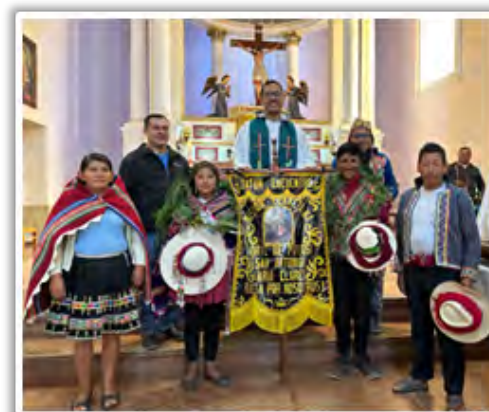
Pasantes del Jatun Encuentro.