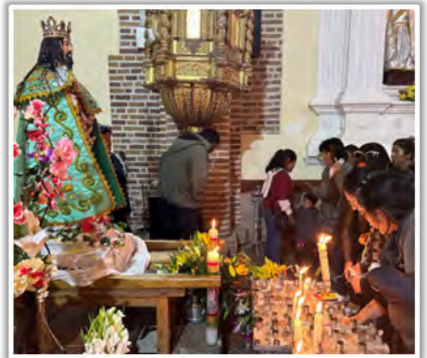
Fuerte devoción en Sacaca.

Este año, la comunidad de Sacaca se unió a la fiesta con un espíritu renovado de esperanza y celebración. Definitivamente, las festividades en honor a Tata San Luis son una oportunidad para fortalecer la comunidad y mantener viva la tradición ancestral que ha sido parte integral de la vida de Sacaca durante generaciones.