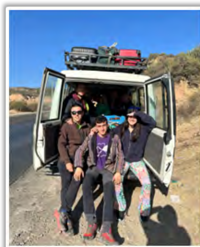
Camino al Norte de Potosí