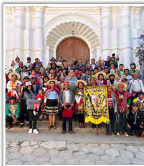
Foto oficial al final del Jatun Encuentro.

El trabajo con ellos es signo concreto de la sinodalidad y la misión compartida.