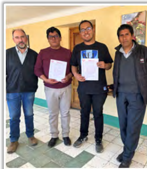
Firma del convenio con Fe y Alegría.