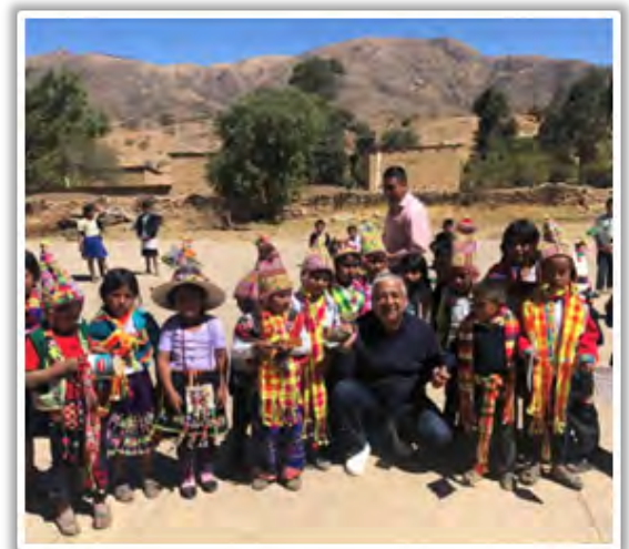
Visita a la comunidad rural de Chiquipampa.

Finalmente, retornó a Cochabamba por la ruta de Toro Toro, de tal manera que pudo conocer otra de nuestras parroquias.