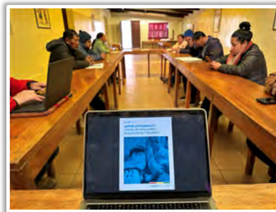
Capacitación sobre protección a menores.