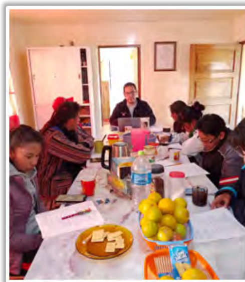
Reunión de catequistas para reiniciar las catequesis.

Agradecemos a los catequistas parroquiales que con compromiso y alegría entregan de su tiempo y experiencia personal, para contagiar y transmitir la alegría del Evangelio.