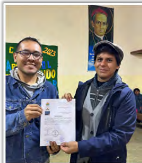
Jóvenes voluntarios dando su taller.

La ganancia de este voluntariado es inmensa. Nuestros adolescentes bachilleres tienen la oportunidad de profundizar sus conocimientos con jóvenes universitarios y estos últimos complementan su formación universitaria con esta experiencia de solidaridad y humanidad, donde aprenden de la cultura, refuerzan sus conocimientos y comparten con la comunidad de misioneros las cenas y la oración matutina.