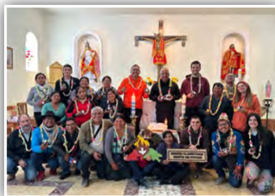
Al final del encuentro y momento de oración.

Concluimos con la Lectio Divina. Esta nos permitió escuchar la invitación de Dios a amar como primer mandamiento de vida, y a comprometernos con el prójimo del extremo Norte de Potosí.