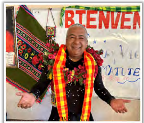
Bienvenida en el HIC de Acasio.

Por ello, estamos agradecidos porque su visita nos alegró y animó a continuar con la labor misionera en el extremo Norte de Potosí.